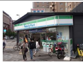
ファミリーマート 徒歩1分(80m)