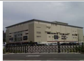
Bivi二条(複合商業施設) 徒歩5分(330m)