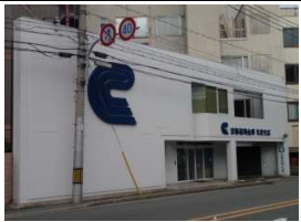
京都信用金庫 徒歩1分(50m)